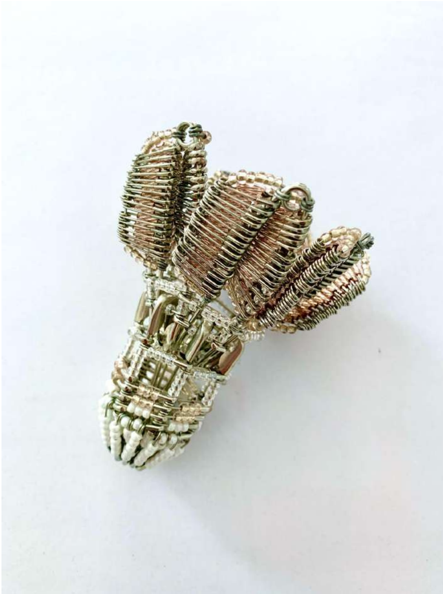
Shige Fujishiro Federball, 2019

Glasperlen, Sicherheitsnadeln, Draht (Aufl. 50, nummeriert), 10 x 7 x 7 cm