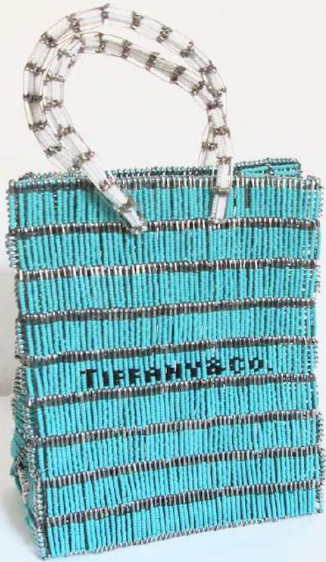
Shige Fujishiro Tiffany ] Co., 2010

Glasperlen, Sicherheitsnadeln, Draht 45 x 25 x 15 cm