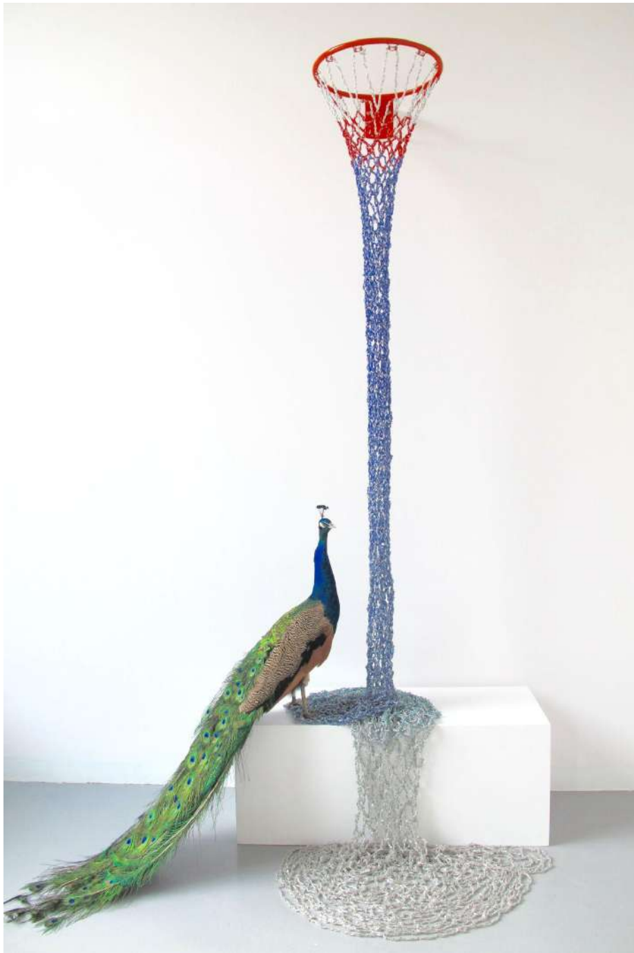
Shige Fujishiro Basketballkorb / Wasserfall, 2015

Glasperlen, Sicherheitsnadeln, Draht, Basketballkorb, Blauer Pfau, ca. 300 x 150 x 80 x cm (variabel)