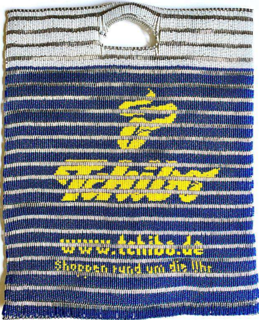
Shige Fujishiro Tchibo, 2020

Glasperlen, Sicherheitsnadeln, Draht 45 x 36 cm