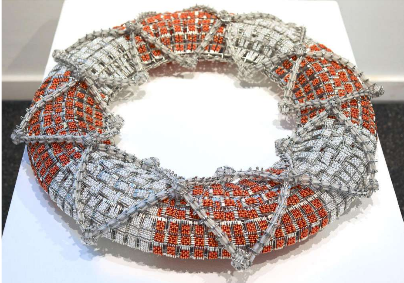
Shige Fujishiro Rettungsring, 2021

Glasperlen, Sicherheitsnadeln, Draht 15 x 75 x 75 cm