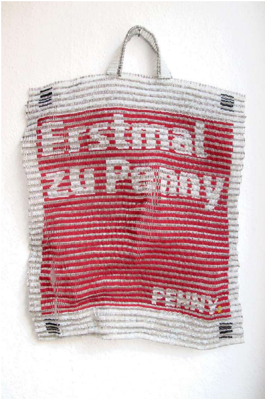
Shige Fujishiro Penny Markt, 2021

Glasperlen, Sicherheitsnadeln, Draht 60 x 46 cm