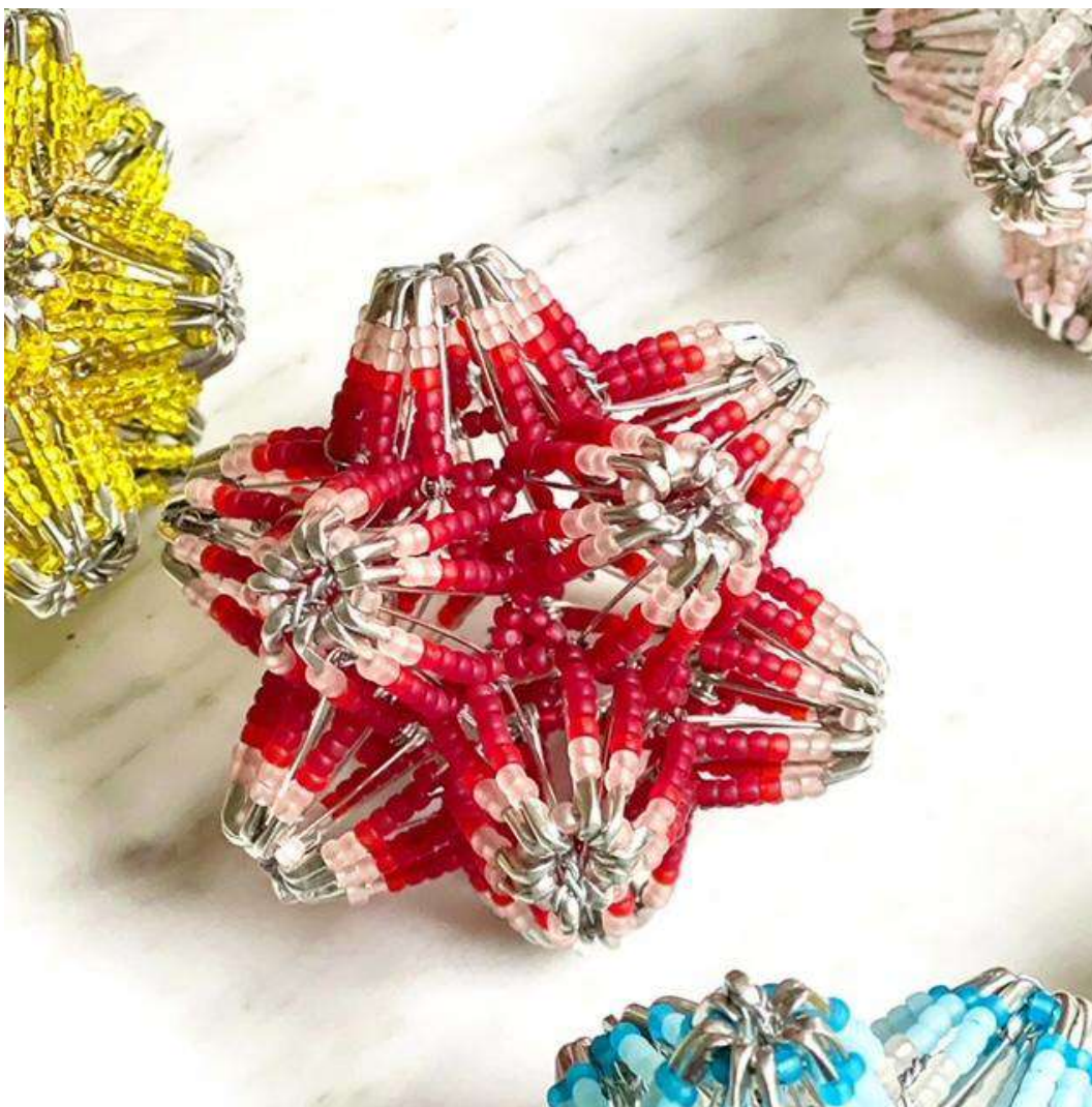
Shige Fujishiro Sterne, 2023

Glasperlen, Sicherheitsnadeln 8 x 8 x 8 cm, offene Aufl.