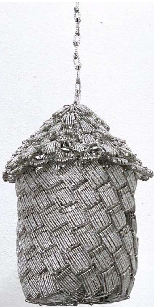
Shige Fujishiro Erinnerung / Vogelhaus, 2023

Glasperlen, Sicherheitsnadeln, Draht 20 x 15 x 15 cm (ohne Seil)