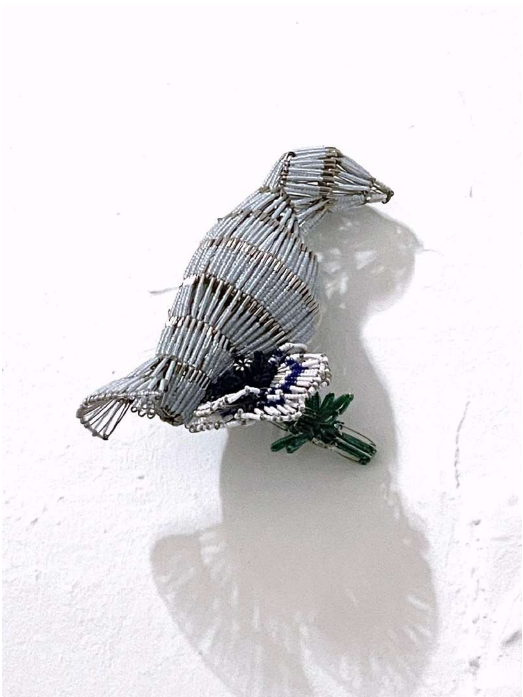
Shige Fujishiro Taube, 2008

Glasperlen, Sicherheitsnadeln, Draht 23 x 18 x 12 cm