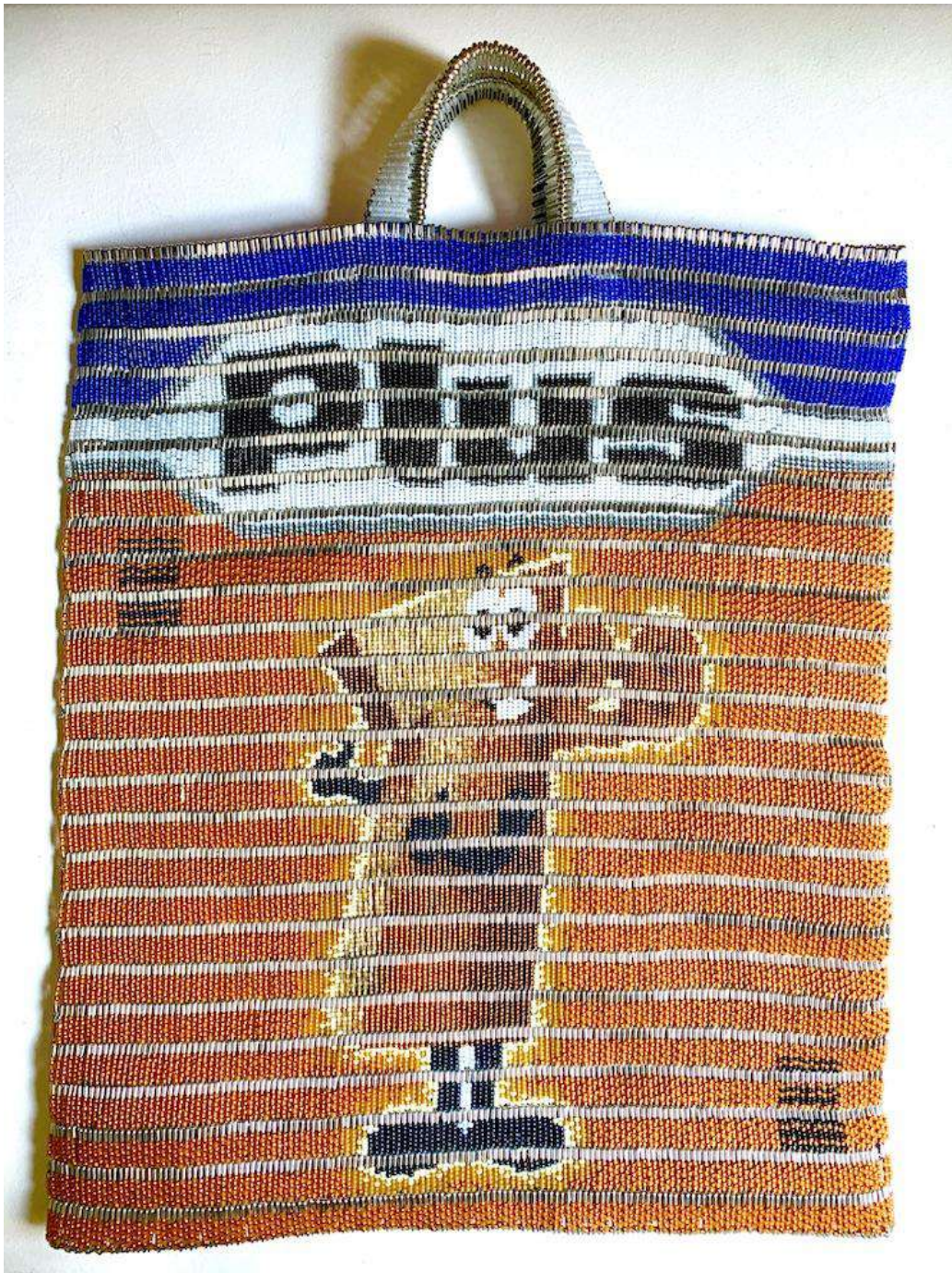
Shige Fujishiro Plus, 2021

Glasperlen, Sicherheitsnadeln, Draht 61 x 44 cm