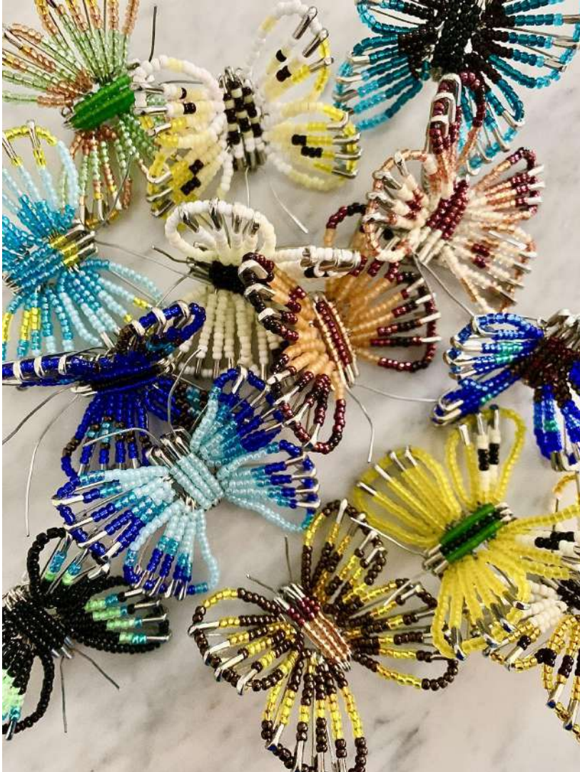
Shige Fujishiro Schmetterlinge, 2023

Glasperlen, Sicherheitsnadeln, Draht 6 x 6 x 6 cm, offene Aufl.